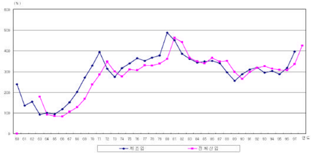
[ 3 ] ( )