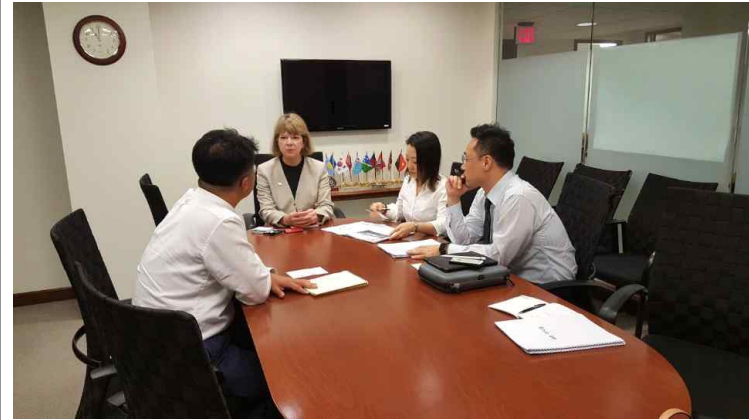
WB 이사실 면담