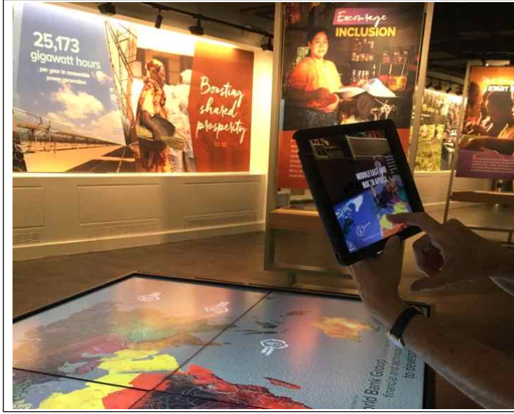
WB Visitor Center 견학