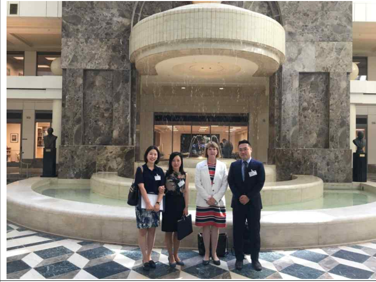
IDB 파트너십 사무국 면담 참석