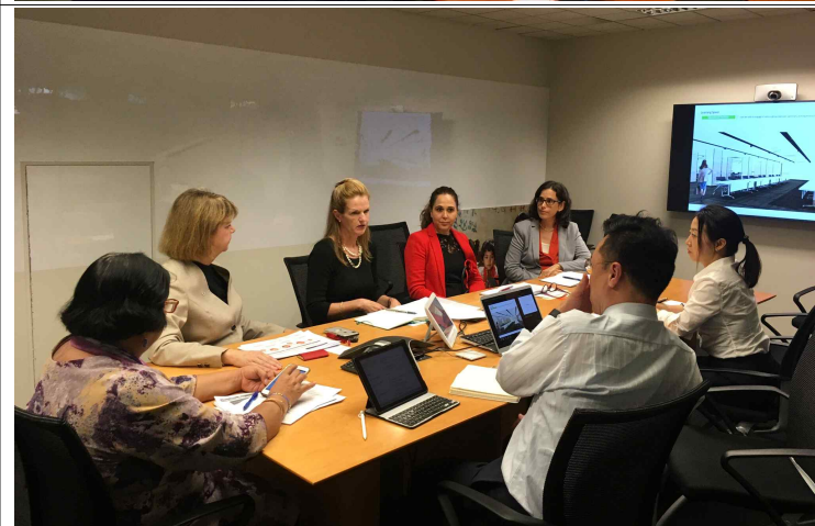
WB DECKM 면담