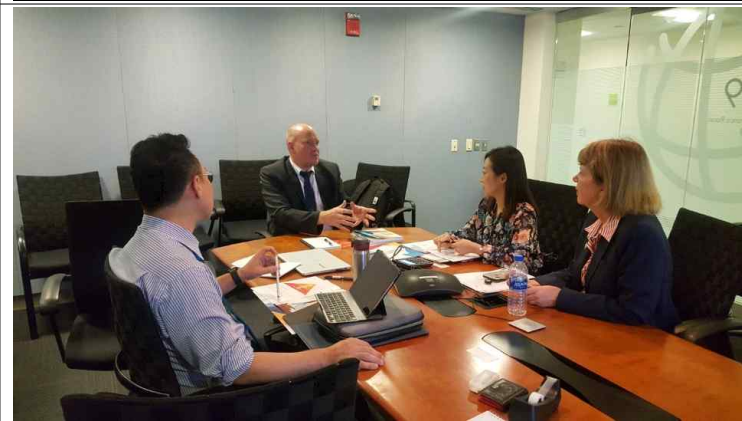
WB 지식공유 전문가 면담