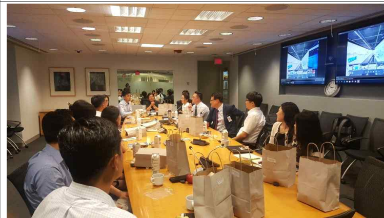
WB/IMF 한국직원협회 면담