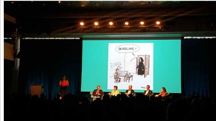
WB 세미나 참석