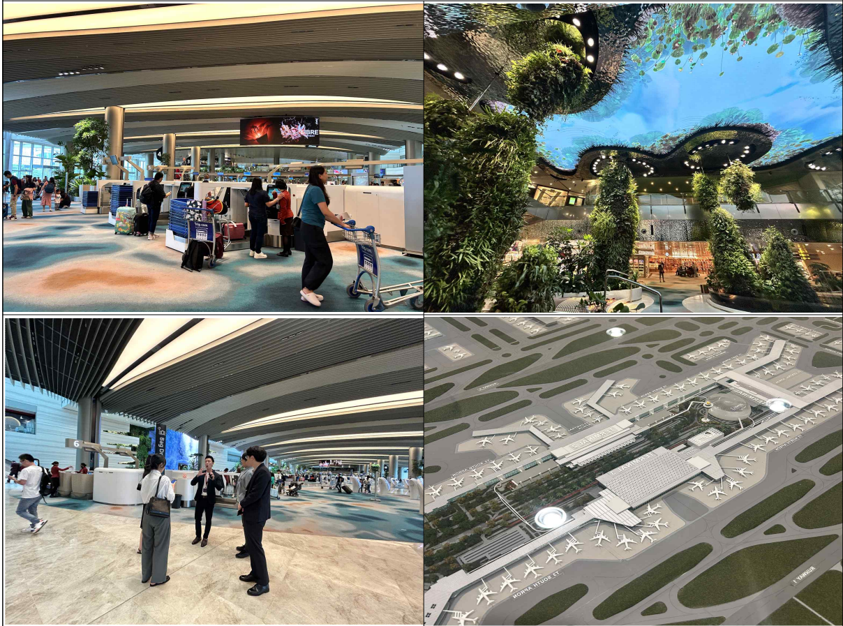
창이공항 T2 운영 실사 (12. 19.)