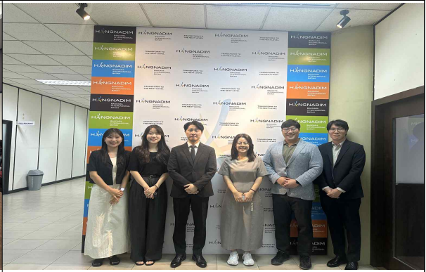
인도네시아 현지법인(PT.BIB) 면담 (12. 20.)