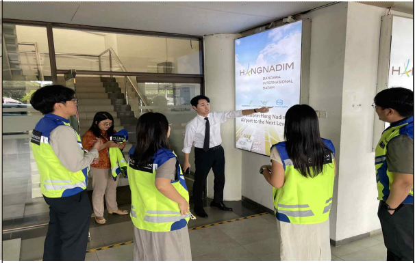
바탐 항나담공항 운영 실사 (12. 20.)