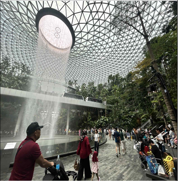
주얼창이 시찰 (12. 21.)