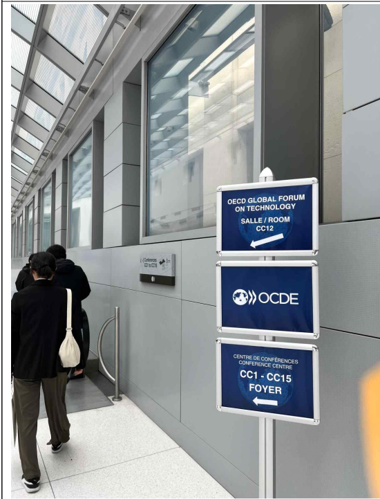
CC5 내려가는 길