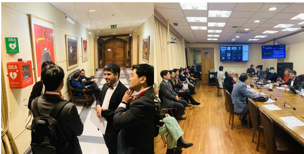
(칠레 하원 보건위원회 방문)