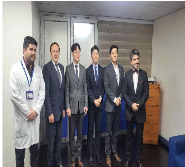
(카를로스 반 부렌 병원 방문 및 면담)