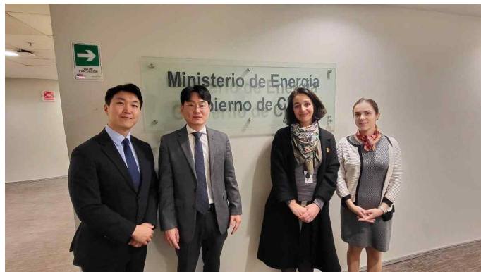
(에너지부 국제협력실 방문 및 KSP 사업 소개)