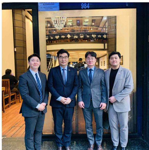
(주칠레 대한민국 대사관 방문 및 면담)