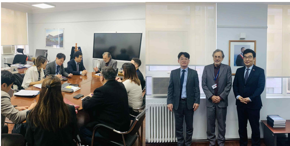
(보건부 공공인프라 차관 면담)