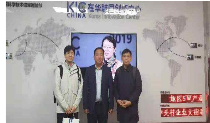
베이징 현지 엑셀러레이팅 제공 등이 있음.