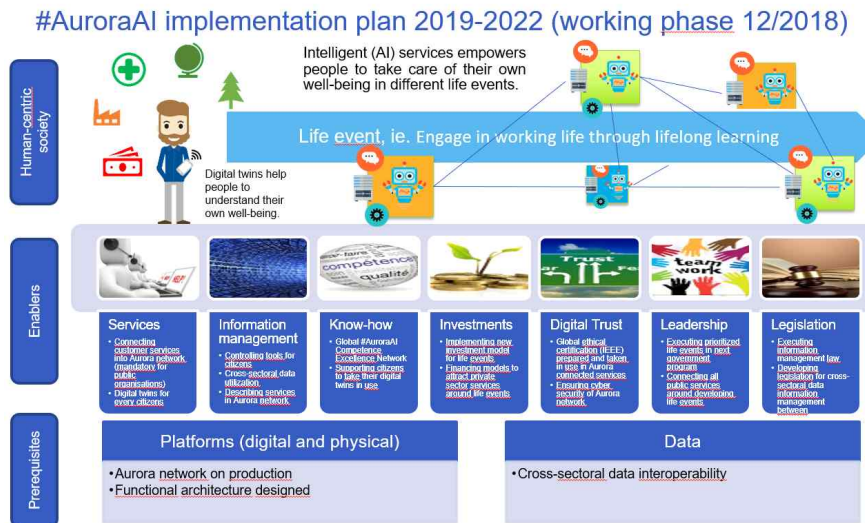
<그림1> AuroraAI 실행 계획