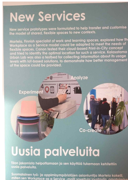
Urban Lab에 부착된 랩 방식에 대한 설명. 실험, 분석을 통해 도시를 함께 만들어 감.