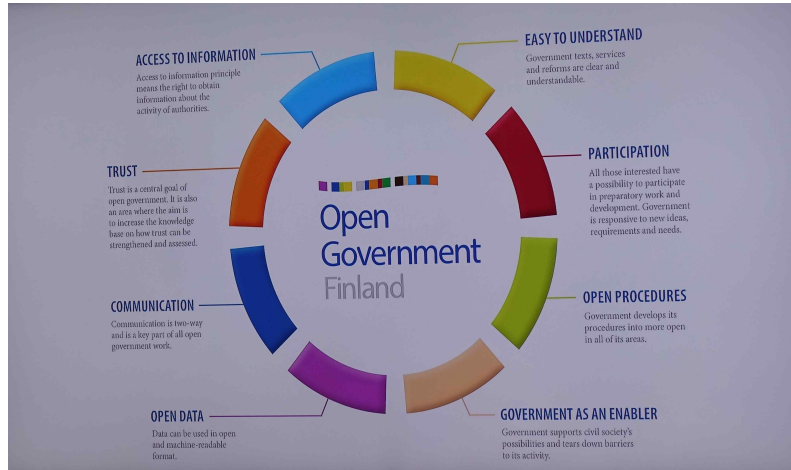
열린 정부를 지향하는 핀란드의 정책 기조