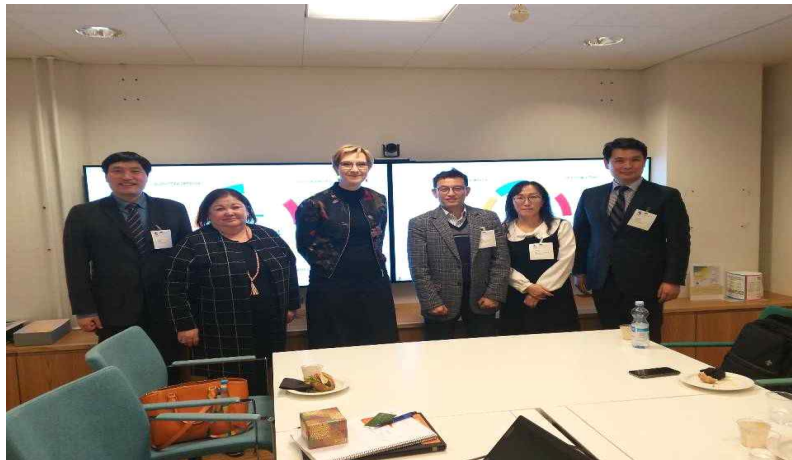
Ministry of Finance 담당자들과