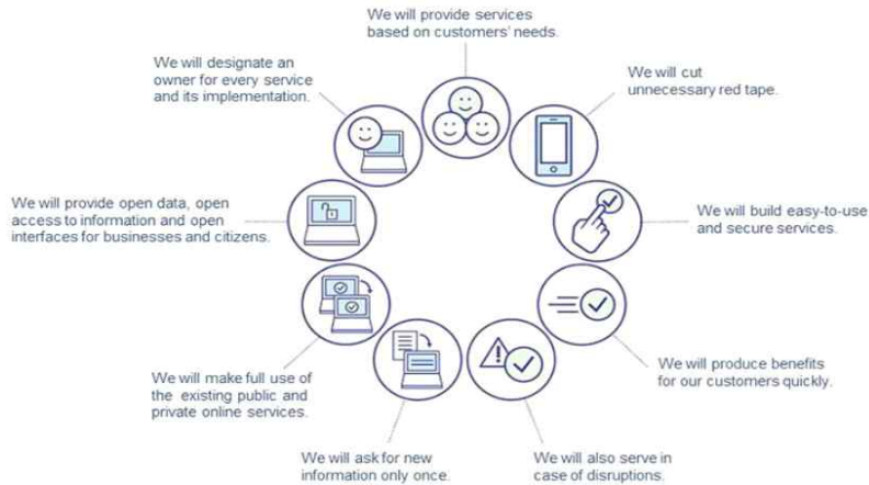
<그림2> 핀란드 디지털화의 9가지 원칙