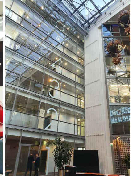
SITRA가 위치한 건물 내부