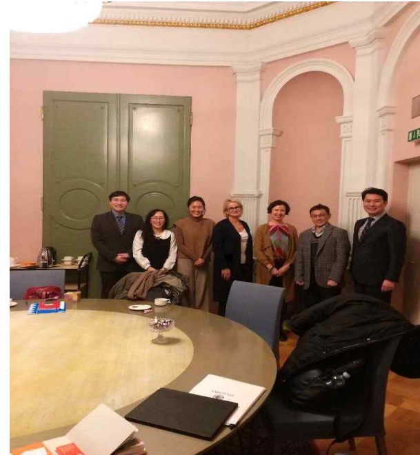
City of Helsinki 면담자들과