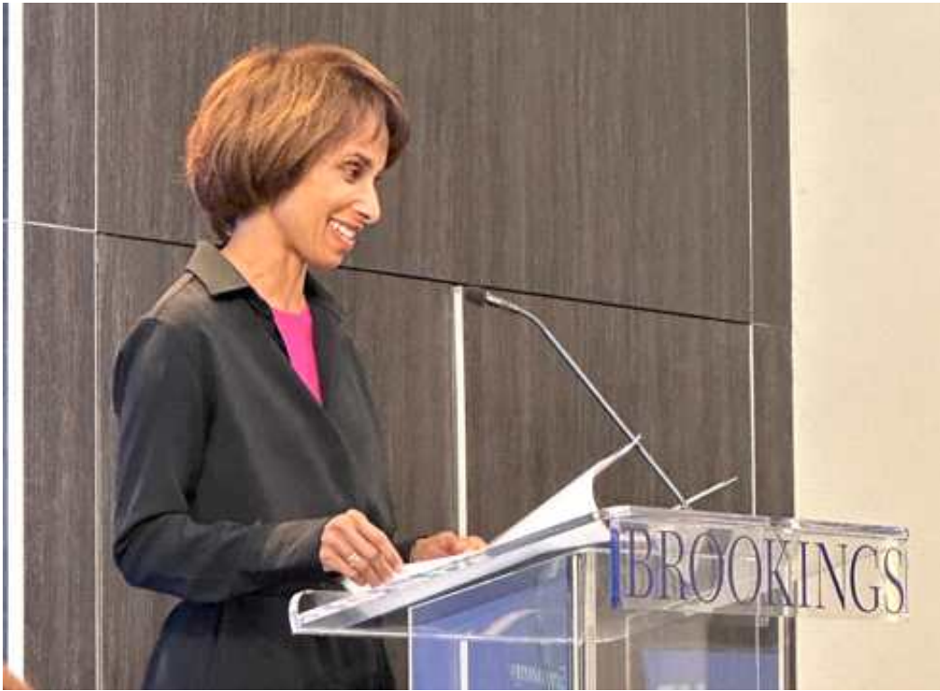
사진 3 <KDI-Brookings 공동연구 발간 기념 행사> Cecilia Elena Rouse 브루킹스 원장 개회사