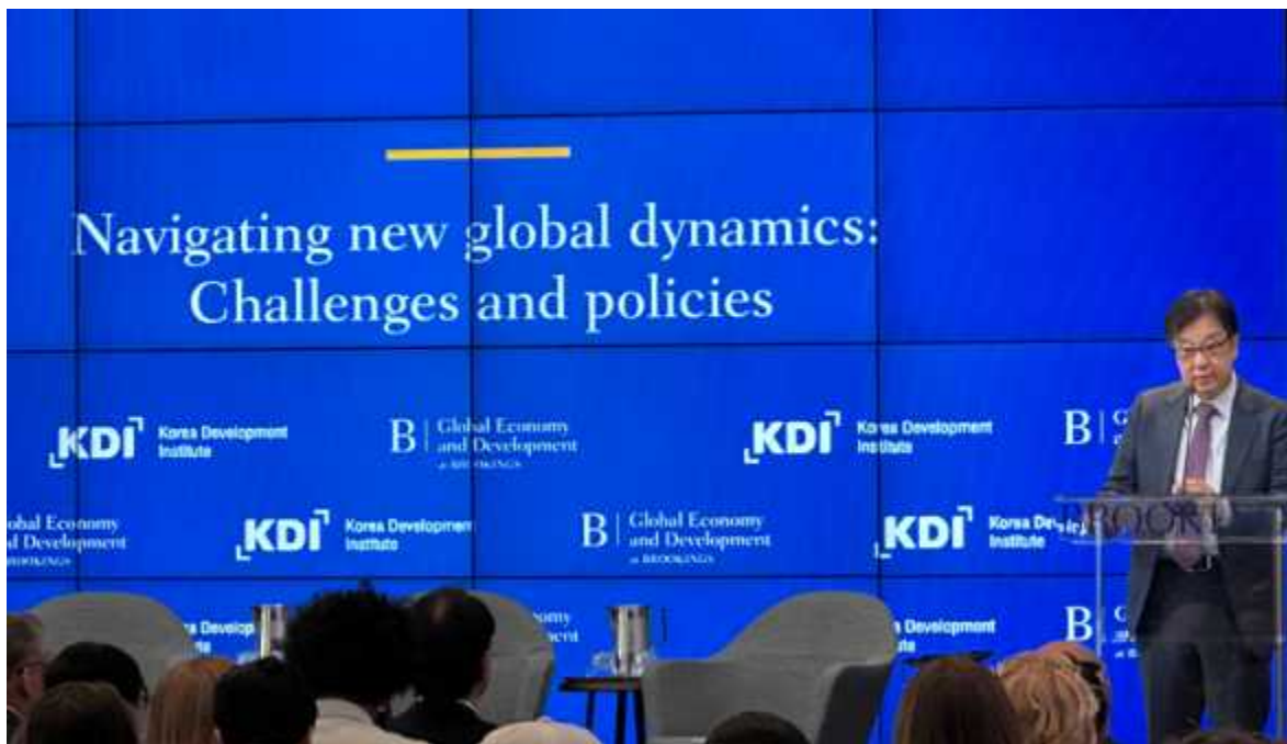
사진 4 <KDI-Brookings 공동연구 발간 기념 행사> 조동철 KDI 원장 개회사