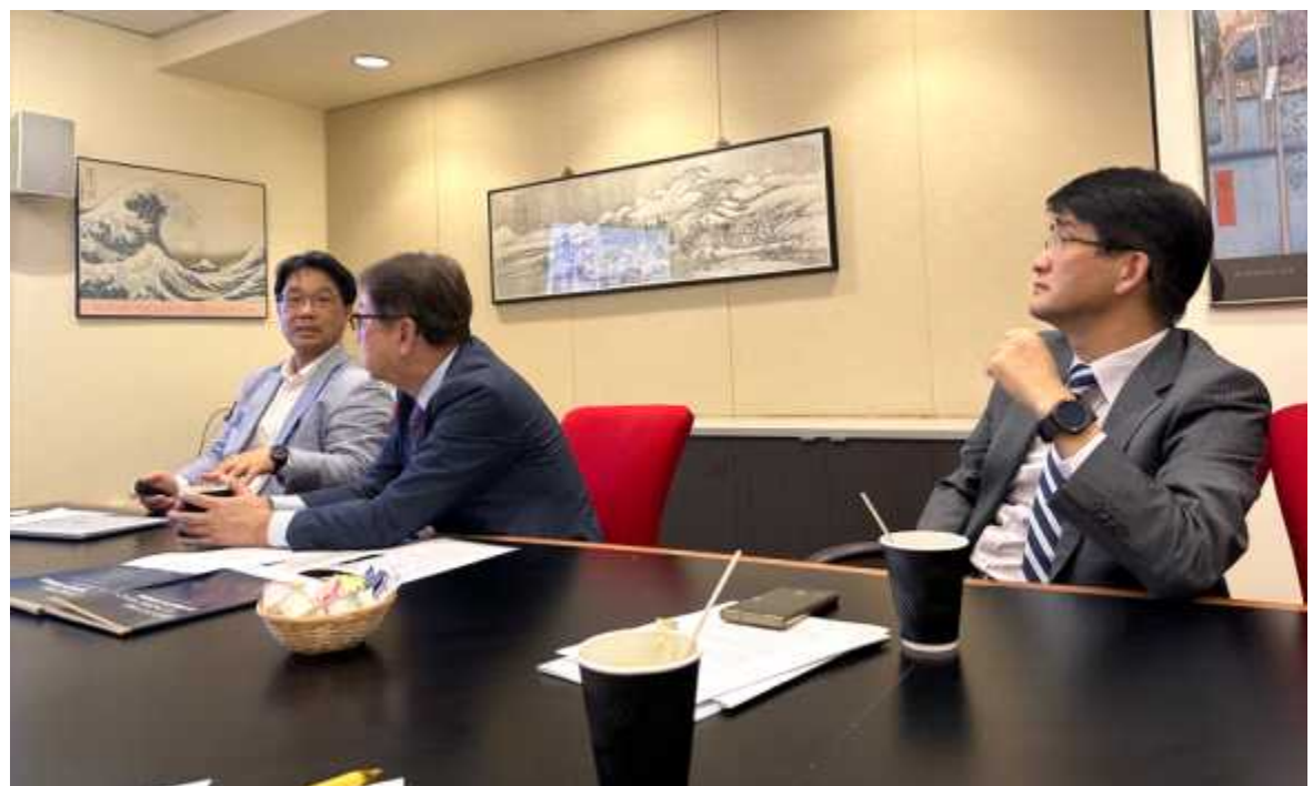
사진 2 <GW 한국학센터 방문> 한국학 프로그램 및 센터 프로그램 설명 청취