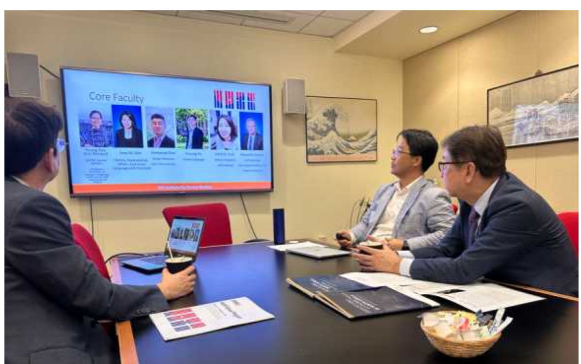
사진 1 <GW 한국학센터 방문> 한국학 프로그램 및 센터 프로그램 설명 청취