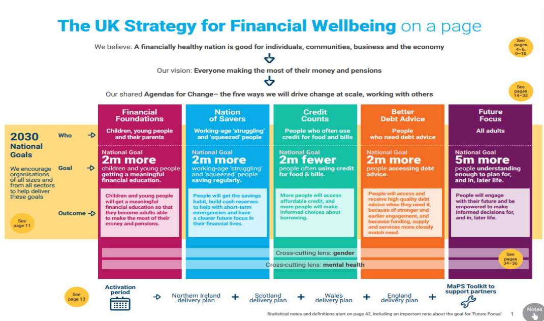
[그림 2] MaPS ‘The UK Strategy for Financial Wellbeing’의 5대 목표