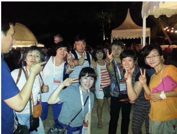
문화의 밤 참석(8.20)