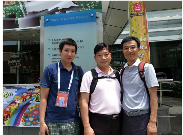
싱가포르 국립도서관 견학(8.17)