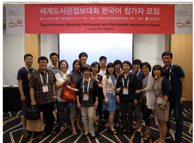
한국어 참가자 모임 참석(8.17)