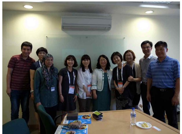
싱가포르 국립대학 도서관 견학(8.21)