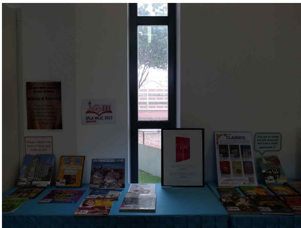
비산 공공도서관 견학(8.17)