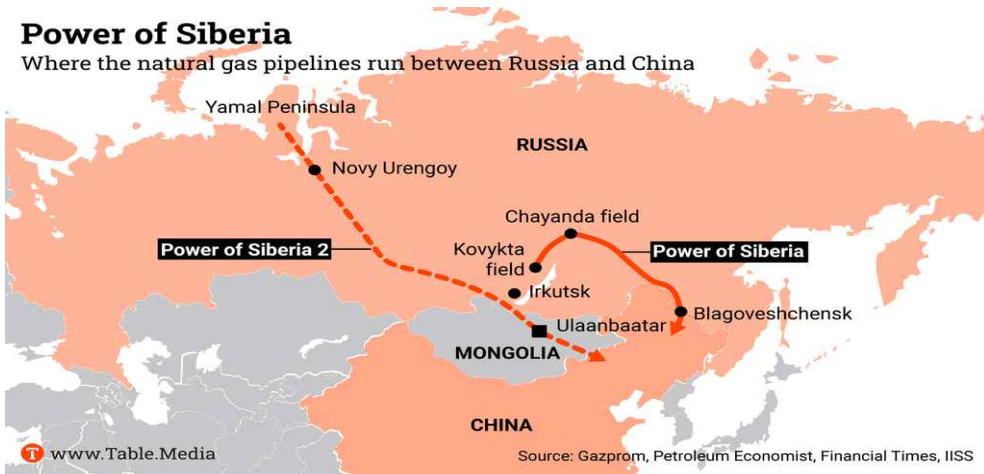
[그림 1] 시베리아의 힘(Power of Siberia) I, II 경로