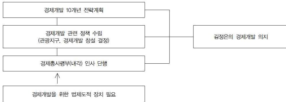
[그림 1] 경제개발구법 제정 배경

김정은 집권 이후 북한은 신년사와 노동당 전원회의에서 대외무역의 다원화와 다각화, 도의 실정에 맞는 경제개발구 설치 등 경제개발에 대해 집중적으로 강조하였으며 경제문제를 내각에 집중시키는 정책도 추구하였다.