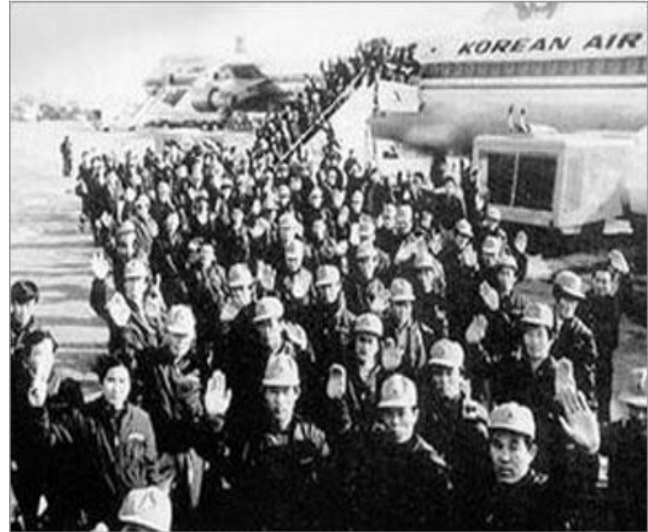
▲1974년 오일 달러를 벌기 위해 한국 건설사와 건설업자들이 속속 중동으로 진출하기 시작했다. 사진은 출국 직전의 현대건설 직원들.